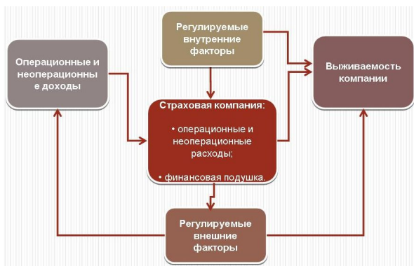
Рис. 1. Модель факторов кризиса

К основным слаборегулируемым внешним факторам относятся следующие: